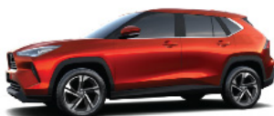
Scarlet SE. (R77)