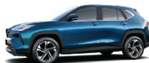
Dark Turquoise SE. (B88)