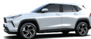
Platinum Pearl White MC. (089)