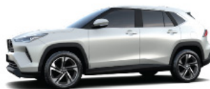
Super White (040)