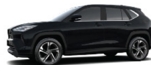
Attitude Black MC. (218)