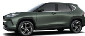
Greenish Gunmetal M.M. (G64)