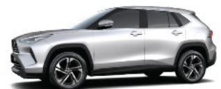
Silver ME. (S28)